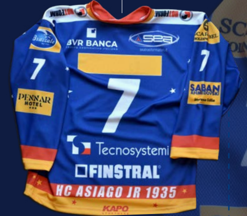
MUTA - 2023/'24 - DIETRO