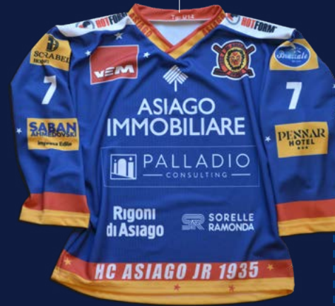
MUTA - 2023/'24 - FRONTE

I BRAND Alla base della "forte sponsorizzazione"!